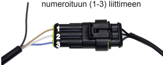
Kuva 3 Anturikaapelin kytkentä 3-napaiseen numeroituun (1-3) liittimeen